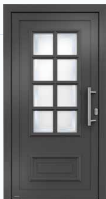
Modell H10878 Hinweis: Nur in Glasfalzfüllung erhältlich. Basisausstattung mit 2-fach Glas. Optional gegen Aufpreis 3-fach Verglasung.

Wir leben im Hier und Jetzt – und schätzen doch die Traditionen. Zu unserem Haus passt nur eine wertsteigernde Haustür im klassischen Stil. Mit eleganter und zeitloser Formensprache. Mit charakteristischen Gestaltungselementen wie Lichtausschnitten oder profilierten Zierleisten. Im Inneren neueste Technik, in der Erscheinung traditionelles Handwerk.